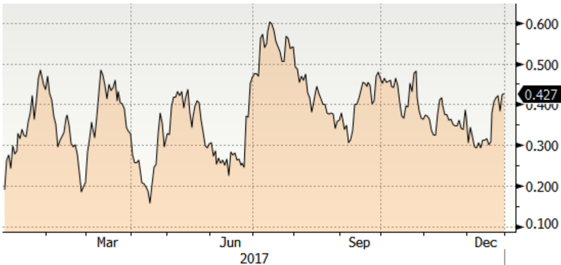
Figuur 2. Renteverloop Duitse 10-jaars staatsrente in 2017